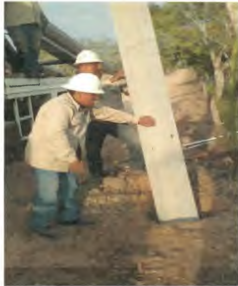
SUMINISTRO E INSTALACION DE POSTE DE CONCRETO DE 12760, INCLUYE RELLENO DE CEPAL CON PIEDRA CALIZA.