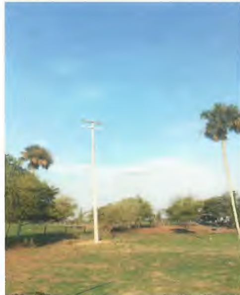
SUMINISTRO E INSTALACION DE CONDUCTOR AAC CAL 1/0 ALUMINIO PURO PARA NEUTRO CORRIDO (8,998 MTS X 0.147 + 8%)

AMPLIACIONES Y CONSTRUCCIONES ELECTRICAS ARANO SA DE CV