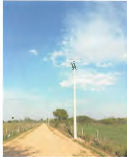
SUMINISTRO E INSTALACION DE CONDUCTOR AAC CAL 3/0 ALUMINIO PURO PARA MEDIA TENSION (9,048 MTS X 0.234 + 8%)