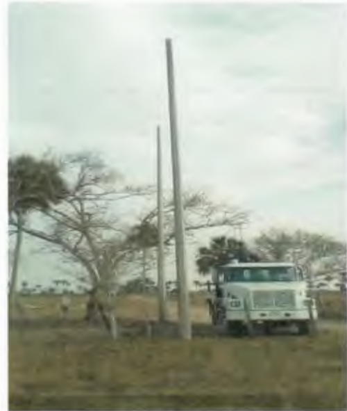
SUMINISTRO E INSTALACION DE POSTE DE CONCRETO DE 12760, INCLUYE RELLENO DE CEPAL CON PIEDRA CALIZA.