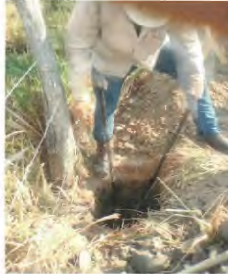
EXCAVACION MANUAL DE CEPA PARA POSTES DE CONCRETO EN TERRENO MIXTO.