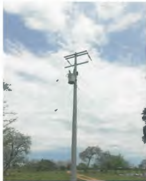
SUMINISTRO E INSTALACION DE CONDUCTOR AAC CAL 3/0 ALUMINIO PURO PARA MEDIA TENSION (9,048 MTS X 0.234 + 8%)