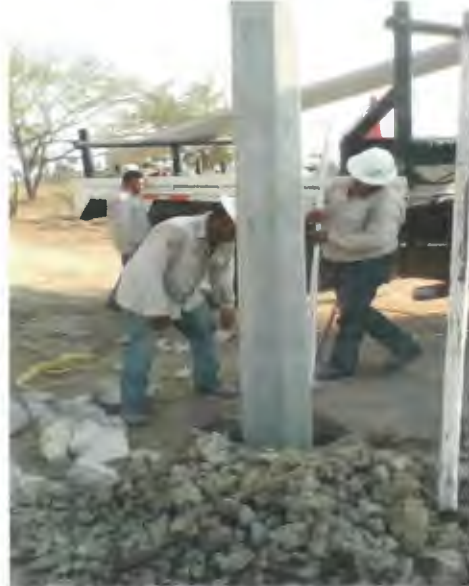
SUMINISTRO E INSTALACION DE POSTE DE CONCRETO DE 12750, INCLUYE RELLENO DE CEPAL CON PIEDRA CALIZA.