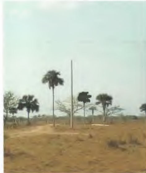
SUMINISTRO E INSTALACION DE POSTE DE CONCRETO DE 12750, INCLUYE RELLENO DE CEPAL CON PIEDRA CALIZA.