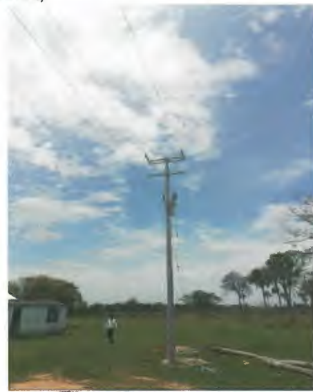
SUMINISTRO E INSTALACION DE CONDUCTOR AAC CAL 1/0 ALUMINIO PURO PARA NEUTRO CORRIDO (8,998 MTS X 0.147 + 8%)

AMPLIACIONES Y CONSTRUCCIONES ELECTRICAS ARANO SA DE CV CONTRATISTA