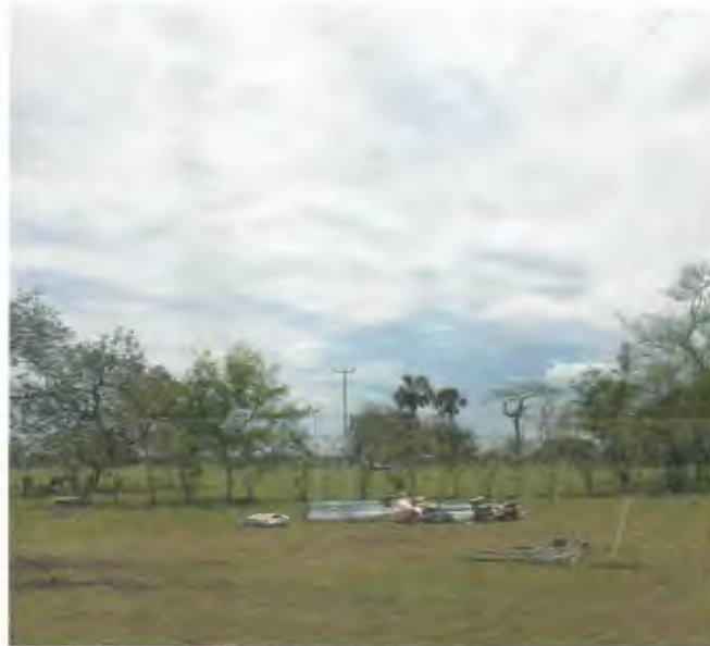
SUMINISTRO E INSTALACION DE CONDUCTOR AAC CAL 3/0 ALUMINIO PURO PARA MEDIA TENSION (9,048 MTS X 0.234 + 8%)

DOMICILIO: MORELOS 803 COL HOJA DEL MAIZ, TIERRA BLANCA, VER.