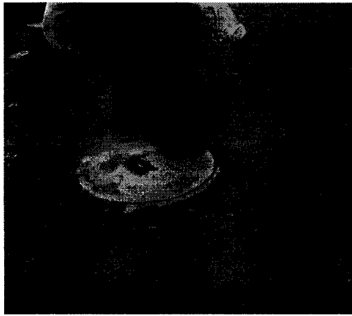
COLOCACION DE BROCAL Y TAPA EN POZO DE VISITA