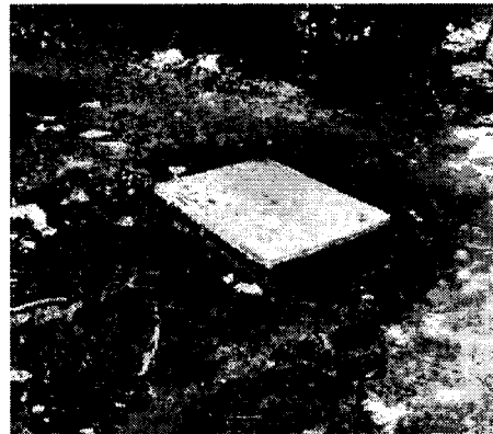
CONSTRUCCION DE DESCARGA DOMICILIARIA