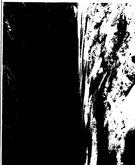
EXCAVACION, TENDIDO Y ACOSTILLADO DE LA TUBERIA DE 8"