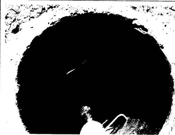
APLANADOS INTERIORES EN POZOS DE VISITA