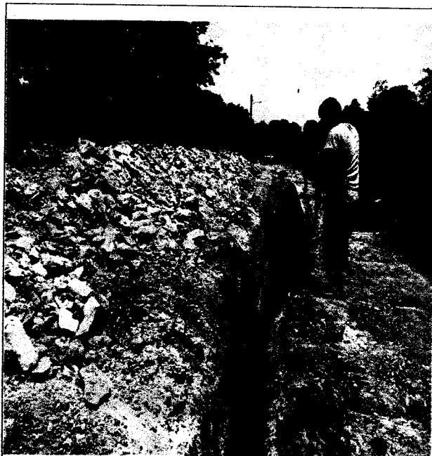
ACOSTILLADO DE LA TURIA DE 8" CON ARENA FINA